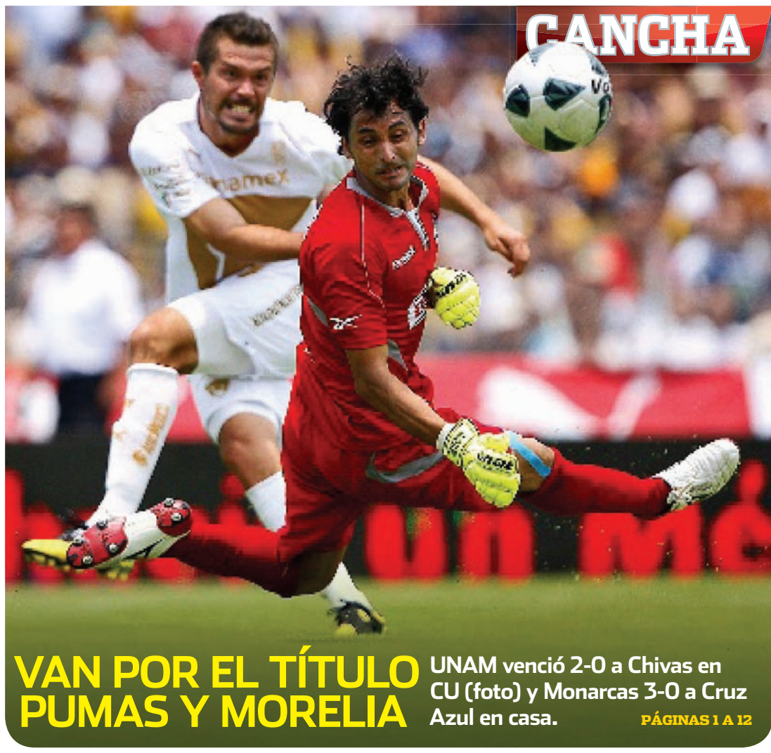
VAN POR EL TÍTULO PUMAS Y MORELIA UNAM venció 2-0 a Chivas en CU (foto) y Monarcas 3-0 a Cruz Azul en casa. PÁGINAS 1 A 12