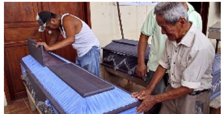
► Las personas asesinadas el sábado en Santiago Choapam, Oaxaca, fueron veladas ayer por sus familiares.