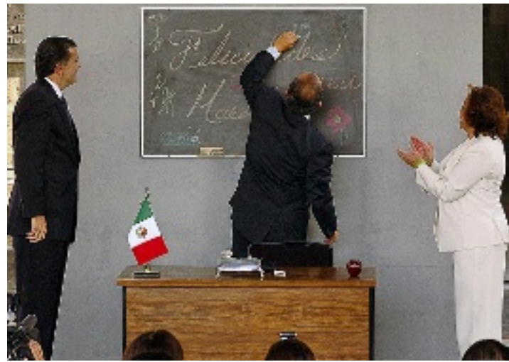
SE PONEN 10. En la ceremonia del Día del Maestro, Calderón escribió un "10" en el pizarrón en el que felicitaban a los profesores.