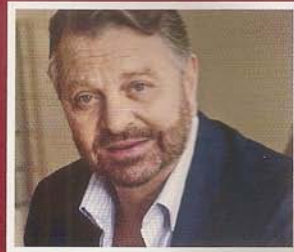
Castañeda, su actual vida amorosa Pág. 212