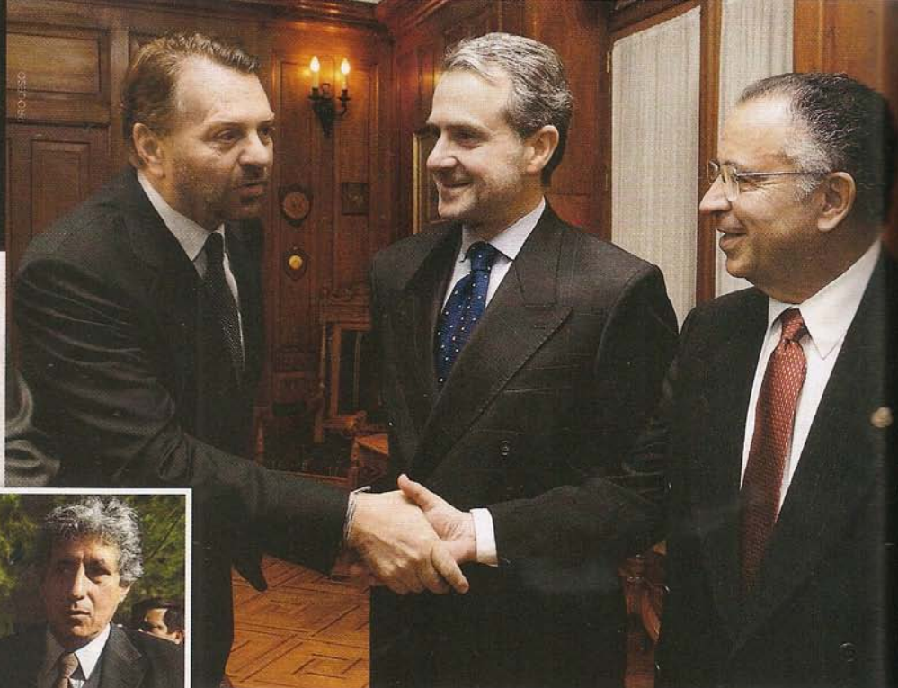
TRABAJARÍA CON CREEL. El ex canciller reconoce que podría colaborar con el ex secretario de Gobernación si éste se convirtiera en presidente de la República.