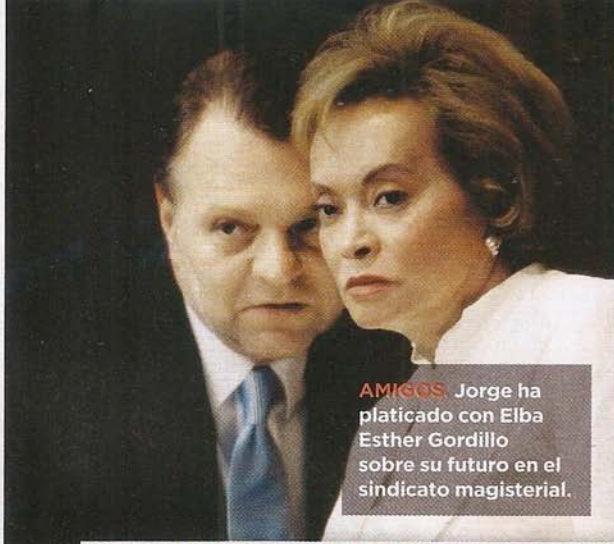
AMIGOS. Jorge ha platicado con Elba Esther Gordillo sobre su futuro en el sindicato magisterial.