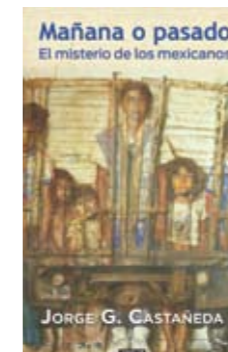
El libro será publicado en tres ediciones diferentes: dos en español y una en inglés.

JC: Este libro está dirigido a tres públicos: el mexicano que vive aquí, el mexicano en Estados Unidos y el público estadounidense. Me doy por bien servido si a una parte de estos tres públicos le gusta el libro. Lo que diga el círculo rojo en México, salvo los que son mis amigos —que son pocos, pero importantes— me viene valiendo madres. ☒